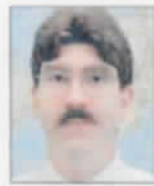
Ο Dr Ντ. Σκοτ Μπένετ, καθηγητής του Πολιτικού Πανεπιστημίου της Πεννσylvανίας.

Ο Άλντον Σταν είναι μόνιμος συνεργάτης του σε σειρά άρθρων και ομιλιών στον εθνικό αμερικανικό τύπο (πολιτικές επιστήμες). Το «Behavioral Origins of Wars» είναι το πρώτο του βιβλίο.