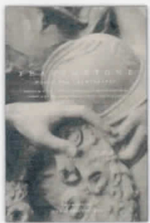
«Tears of Stone», Jane Alden Stevens, εκδ. «Methuen Photo».

Οι σοφοί 290.000 νεκρών αποσιγήθηκαν αόριστα από το πεδίο της μάχης. Οι υπόλοιποι 700.000 είχαν γίνει κομμάτια. Αυτά τους αποκαλούν από τον Πρώτο Πόλεμο τόπους της Ευρώπης περιηγήθηκε δύο ολόκληρα χρόνια, φοροποιήθη τη φωτογραφική της μηχανή, η καθηγήτρια Καλώς Τεχνών του Πανεπιστημίου του Στάνφορντ Jane Alden Stevens. Η προσωπική της αναζήτηση, καταγεγραμμένη σε ασπρόμαυρο φιλμ, γίνεται σήμερα επίσημα κι αναγνώριση μιας αληθινής καλλιτεχνικής και μαζί σημείο ταύτισης και συγκίνησης, χάρη στον τίτλο «Tears of Stone: The World War I Remembered», που κυκλοφόρησε στις 12 Μαΐου.